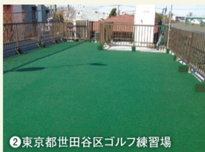
②東京都世田谷区ゴルフ練習場