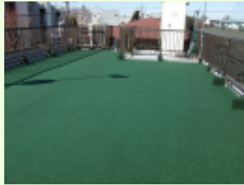
* 2 東京都世田谷区ゴルフ練習場